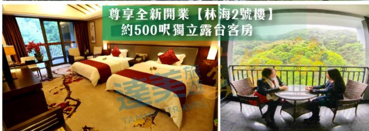
尊享全新開業【林海2號樓】 約500呎獨立露台客房