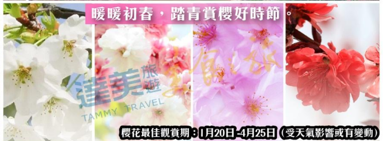
暖暖初春，踏青賞櫻好時節