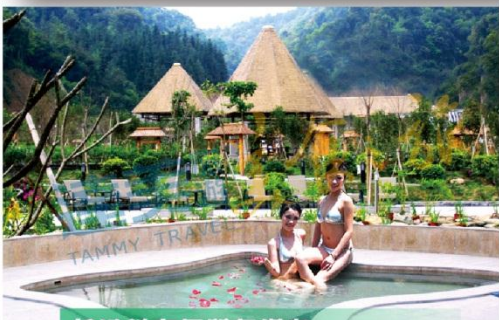
任浸稀有優質氣溫泉 — 45個特色溫泉池