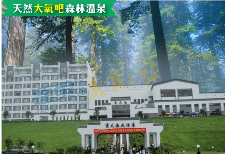
天然大氧吧森林溫泉