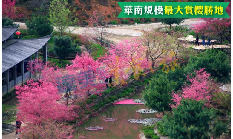
華南規模最大賞櫻勝地