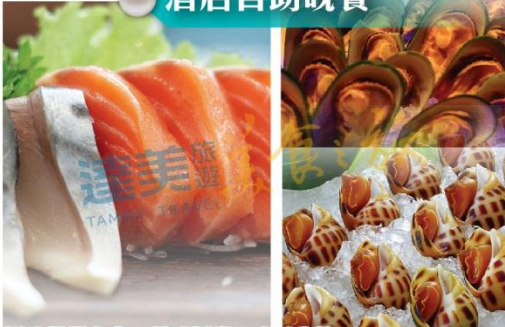
圖片僅供參考，菜式以當天出品為準!!