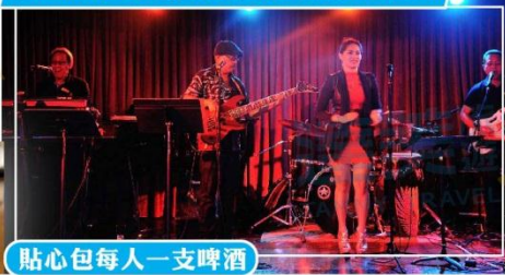
貼心包每人一支啤酒