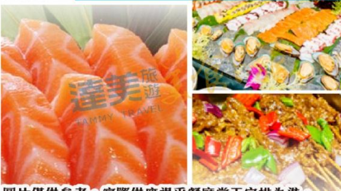
圖片僅供參考，實際供應視乎餐廳當天安排為準。