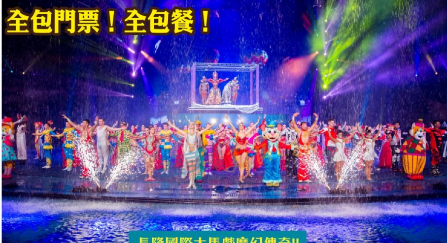
長隆國際大馬戲魔幻傳奇II