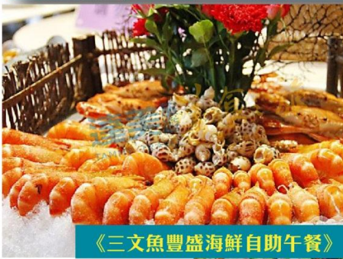
《三文魚豐盛海鮮自助午餐》