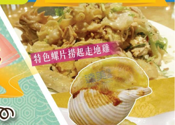
特色螺片撈起走地雞