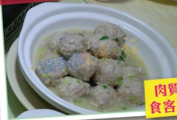
肉質鮮味, 食客讚不絕口