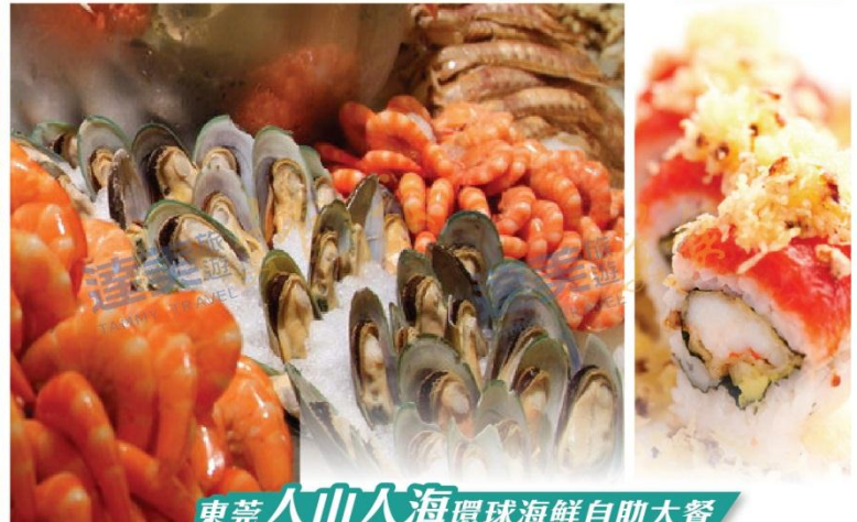
東莞人山人海環球海鮮自助大餐