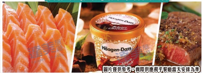
圖片僅供參考，實際供應視乎餐廳當天安排為準