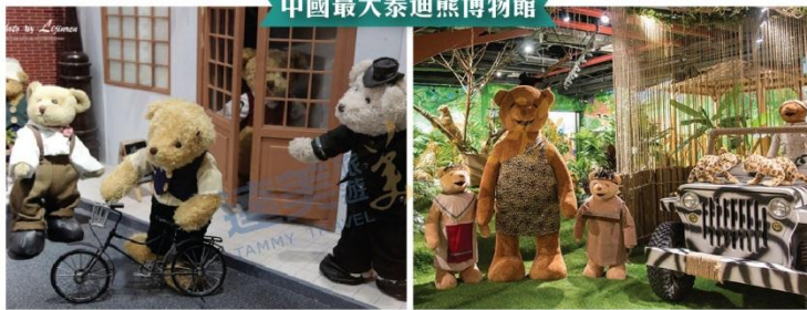
中國最大泰迪熊博物館