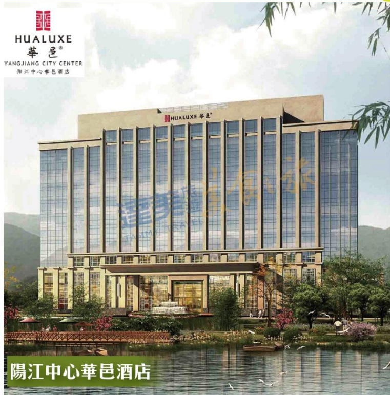
陽江中心華邑酒店