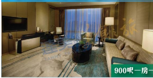
900呎一房一廳行政大床套房