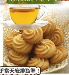
菜單圖片僅供參考，實際供應視乎當天安排為準！