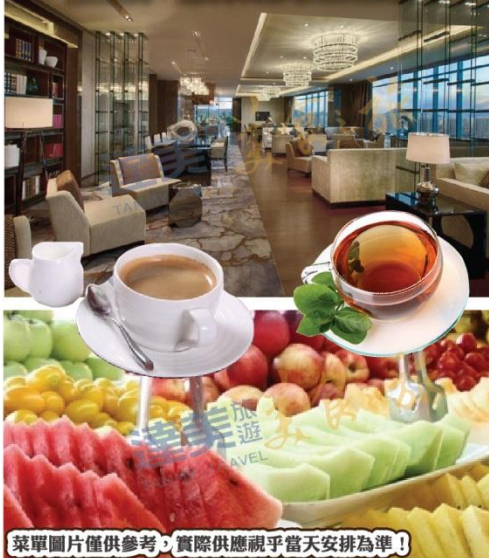
菜單圖片僅供參考，實際供應視乎當天安排為準！

週末出發團隊，晚上19:30-22:00於酒店24樓行政酒廊，免費享用咖啡/茶及新鮮水果