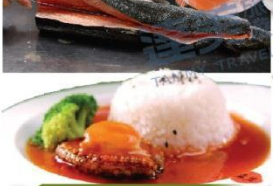
尊享位上鮑魚撈飯