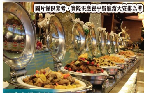
圖片僅供參考，實際供應視乎餐廳當天安排為準