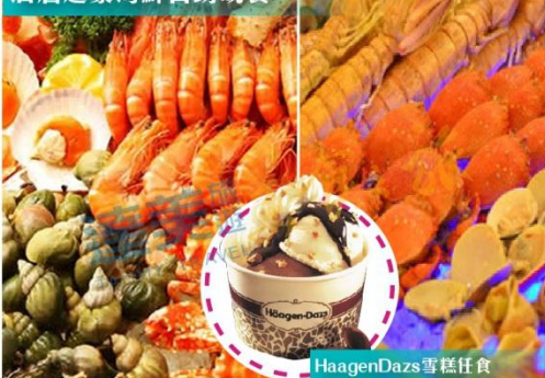
酒店超豪海鮮自助晚餐