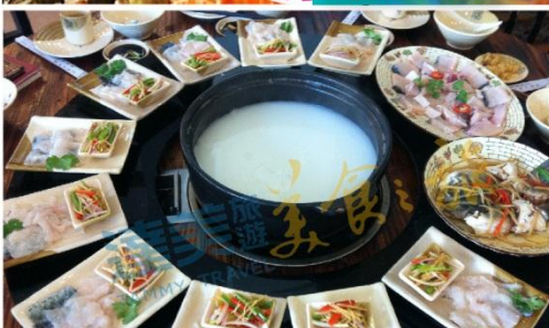
椰青無骨魚火鍋宴