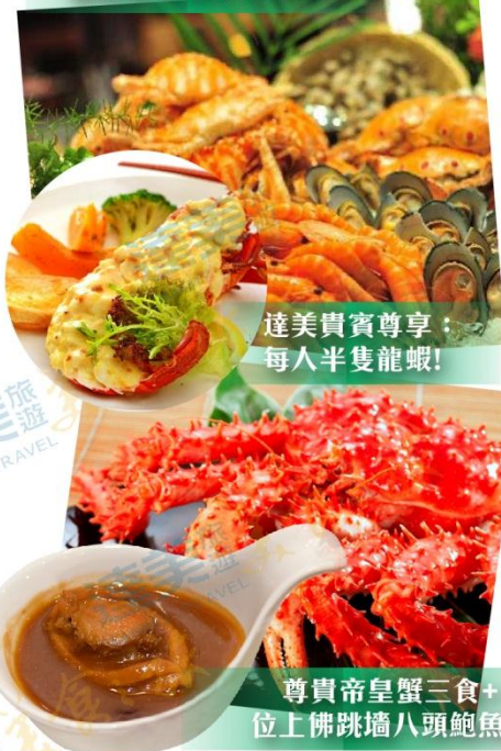
達美貴賓尊享：每人半隻龍蝦！