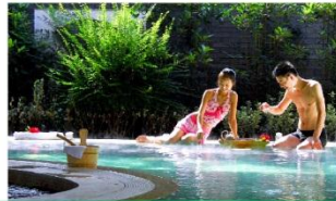
任浸戶外52個【世界珍稀蘇打氫溫泉池】