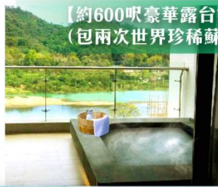
【約600呎豪華露台客房】房內特設獨立溫泉池（包兩次世界珍稀蘇打氫溫泉池水）