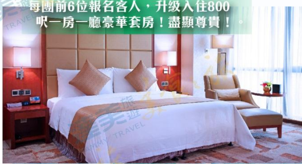
每團前6位報名客人，升級入住800呎一房一廳豪華套房！盡顯尊貴！