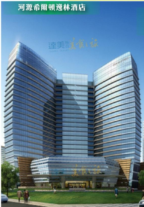
河源希爾頓逸林酒店

晚上 19:30-22:00 於酒店 24 樓行政酒廊，免費享用咖啡/茶及新鮮水果，享受高人一等！盡顯尊貴！