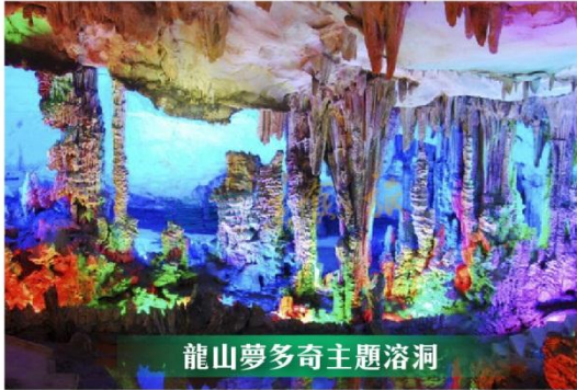
龍山夢多奇主題溶洞