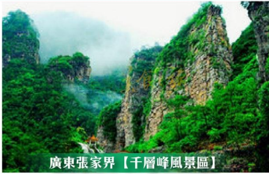
廣東張家界【千層峰風景區】