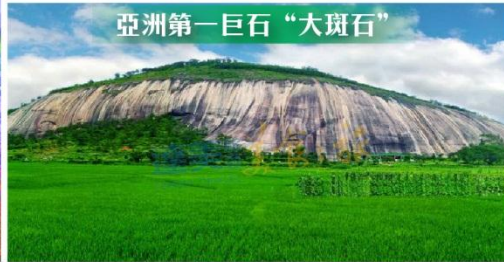
亞洲第一巨石“大斑石”