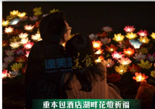
重本包酒店湖畔花燈祈福