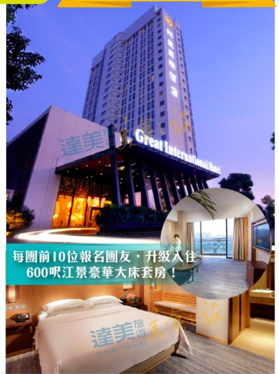
每團前10位報名團友，升級入住 600呎江景豪華大床套房！