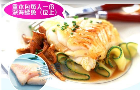
重本包每人一份 深海鱈魚 (位上)