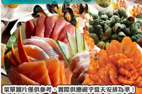
菜單圖片僅供參考，實際供應視乎當天安排為準！