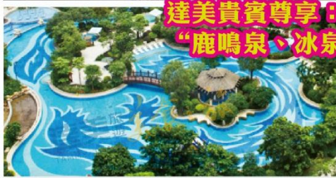
達美貴賓尊享：4大純天然溫泉池 “鹿鳴泉、冰泉、湖山泉、高溫泉”