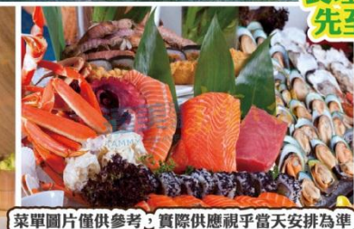
菜單圖片僅供參考，實際供應視乎當天安排為準！